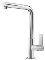
Miscelatore Omega 8497 000