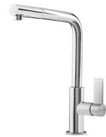
Miscelatore Omega Plus 8497 020