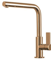
Miscelatore Omega Copper 8497 400