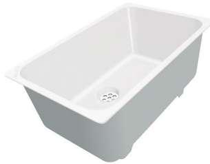
Vaschetta bianca 8153 100